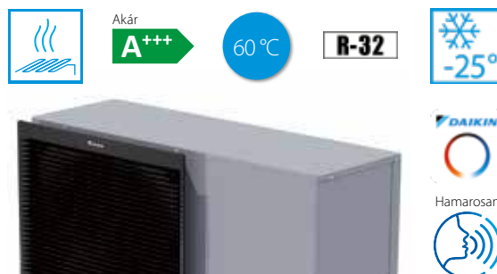
Daikin Monoblokk hőszivattyú